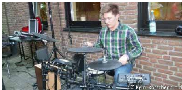
Schlagzeug K2 Band